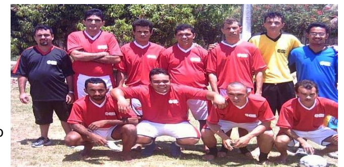
Na foto, o Mucuripe que foi vice na 1ª copa

Dia 17 de março terá início no estádio Castelinho, a 2ª copa CCB de futebol, com a participação de 2 times por obra. É esperado a participação de 12 times, 2 a mais que na 1ª copa, a reunião com os representantes dos times será dia 10 de março no Ed. Notting Hill. Esse ano o Terraços do Atlântico já reservou o local do troféu.